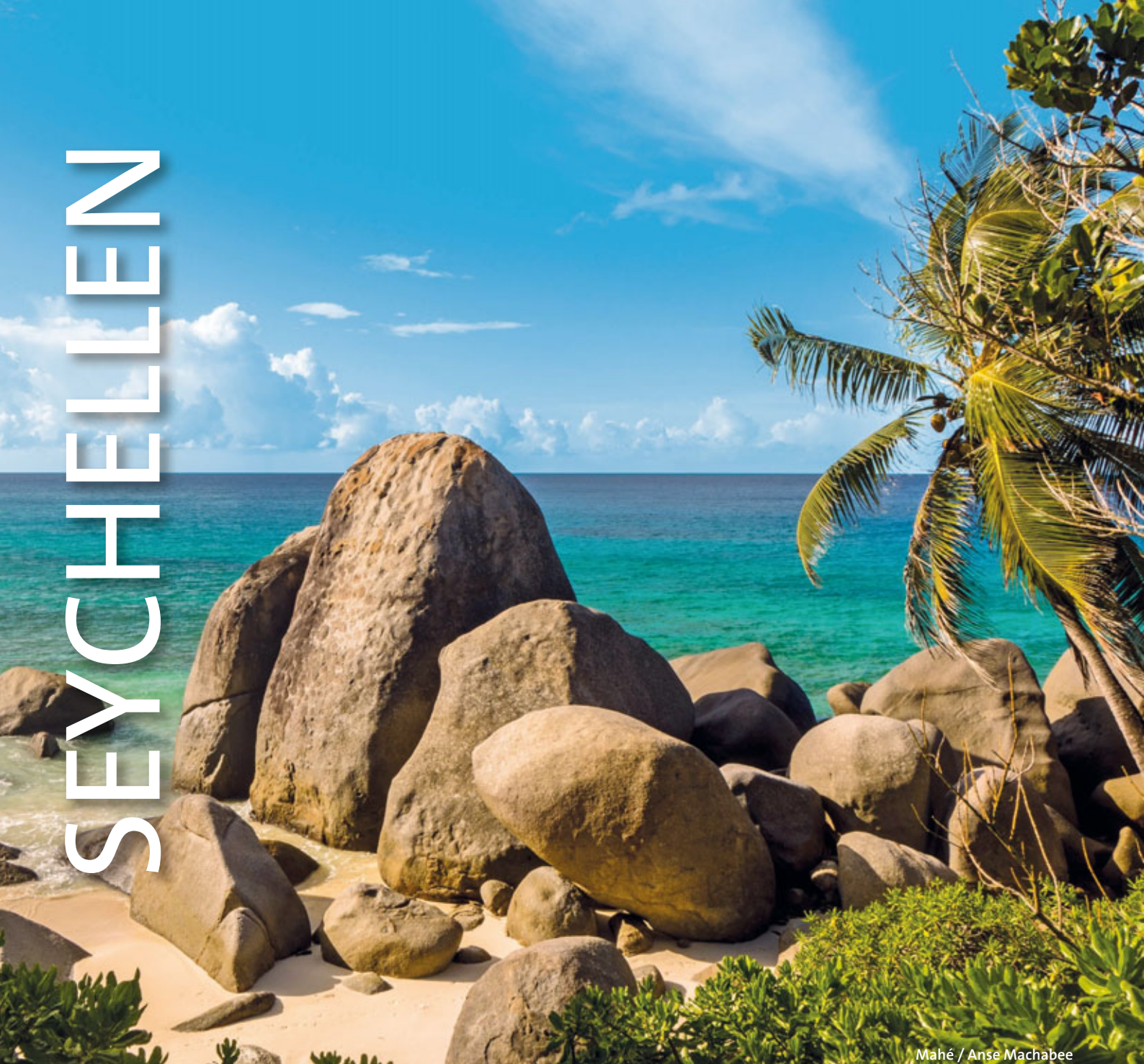
Mahé / Anse Machabee