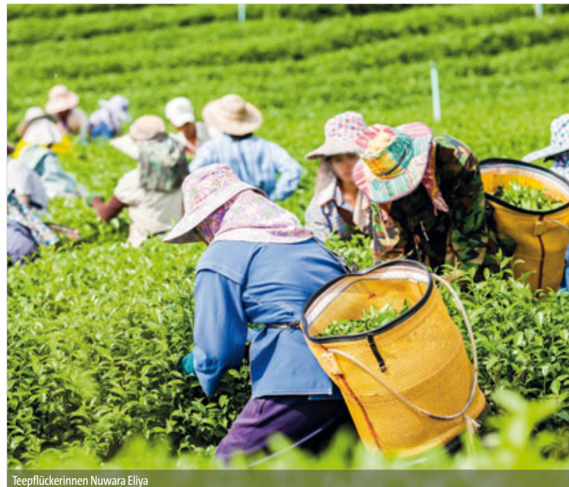
Teepflückerinnen Nuwara Eliya