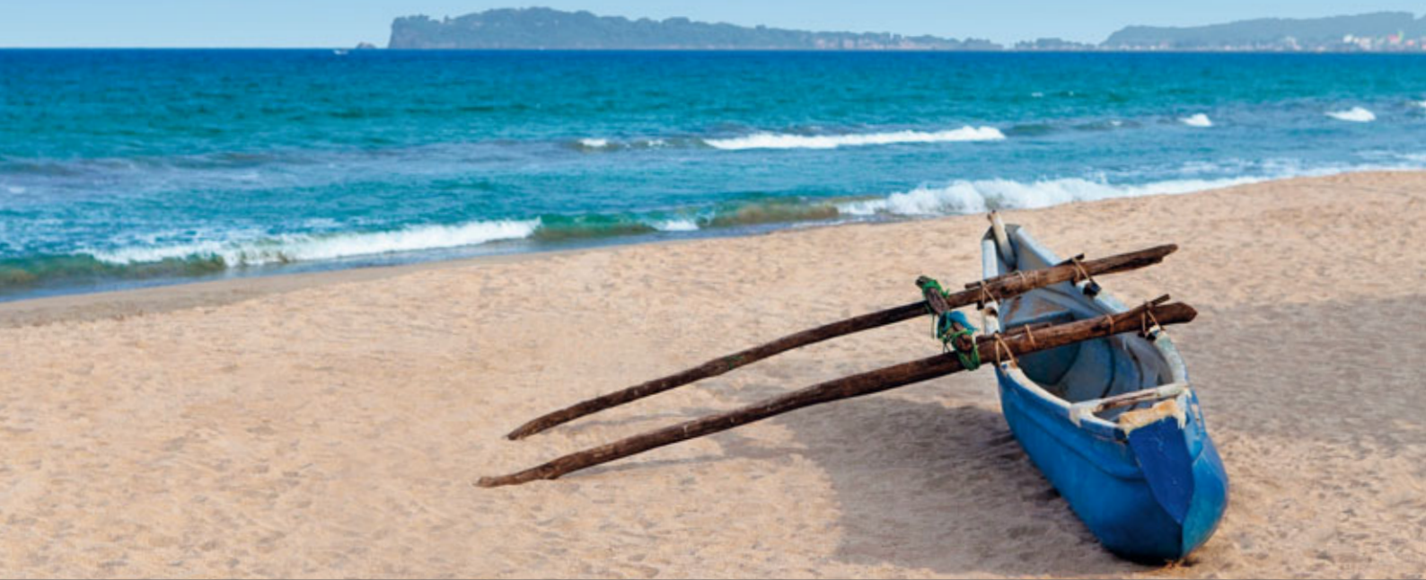
Strand mit traditionellem Fischerboot