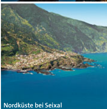
Nordküste bei Seixal