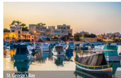
St. George's Bay