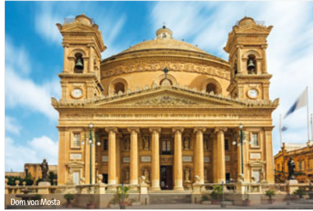
Dom von Mosta