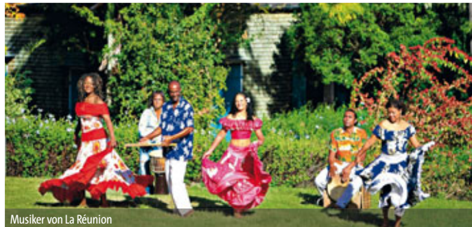
Musiker von La Réunion