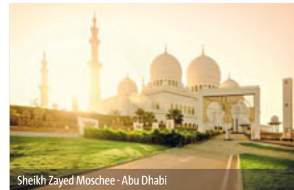
Sheikh Zayed Moschee - Abu Dhabi