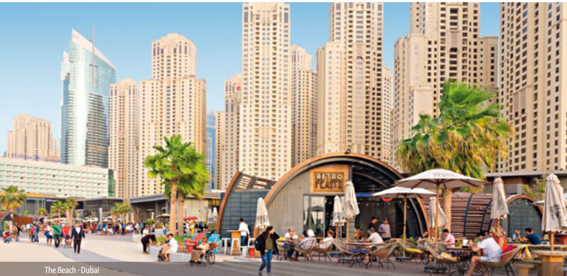
The Beach - Dubai

AKTIVURLAUBER KULTURINTERESSIERTE DEUTSCH SPRECHEND