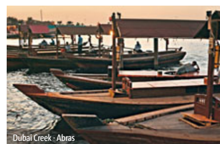
Dubai Creek - Abas