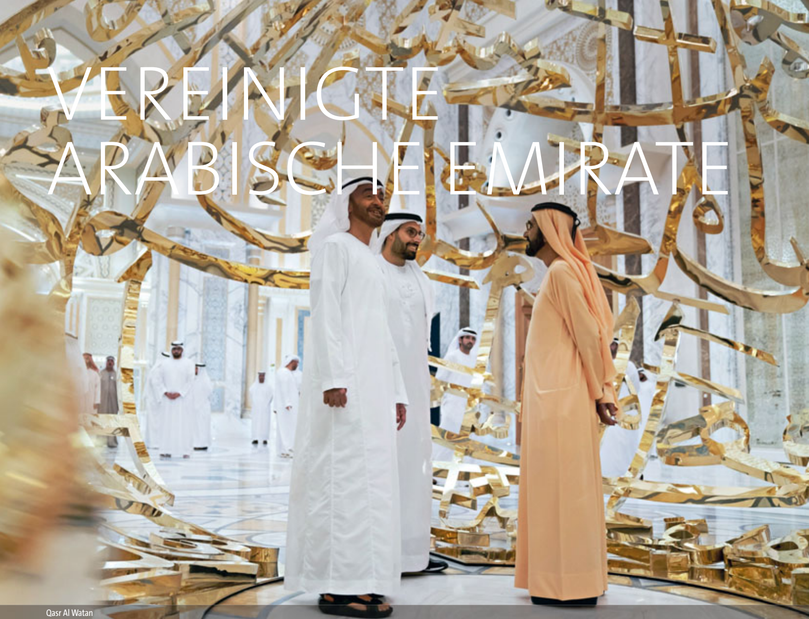
Qasr Al Watan