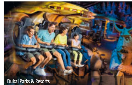
Dubai Parks & Resorts