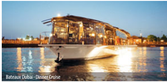
Bateaux Dubai - Dinner Cruise