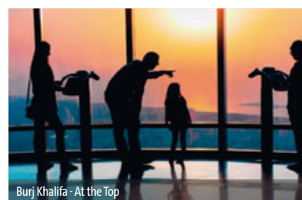
Burj Khalifa - At the Top