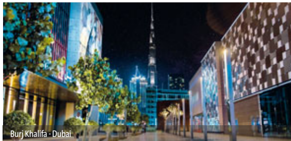
Burj Khalifa - Dubai