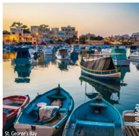
St. George's Bay

Es lebe die Vielfalt! Auf den Inseln der kleinen Wege ist einfach für jeden etwas zu erleben. Traumhafte Buchten, idyllische Fischerdörfer und anmutige Paläste sind nur ein Bruchteil des herrlichen Malta Mixes, den es zu erkunden gilt. Kommen Sie nach Malta und treten Sie ein in eine Welt der starken Ritter, eine Welt der schönen Landschaften und in eine Welt der köstlichen Delikatessen! Durch die Geschichte hindurch wurde das Archipel besiedelt von den Arabern, den Römern, den Ordensrittern, den Briten und vielen mehr. Warum wollte nur jeder diese kleinen Inseln besitzen?