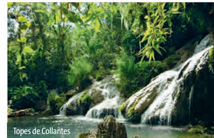
Topes de Collantes