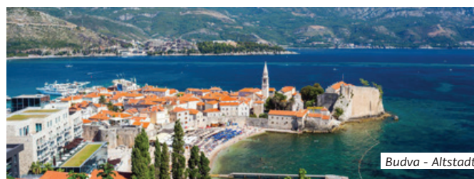
Budva - Altstadt