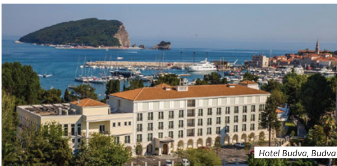
Hotel Budva, Budva

Schweizer Bürger benötigen lediglich einen Reisepass, der 3 Monate über das Rückreisedatum gültig ist. Andere Staatsbürger informieren sich bitte bei dem zuständigen Konsulat.