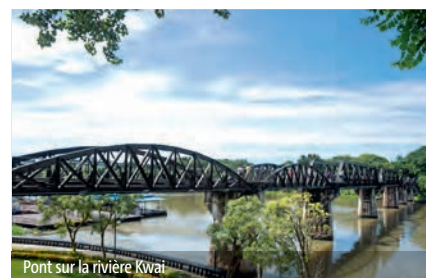
Pont sur la rivière Kwai