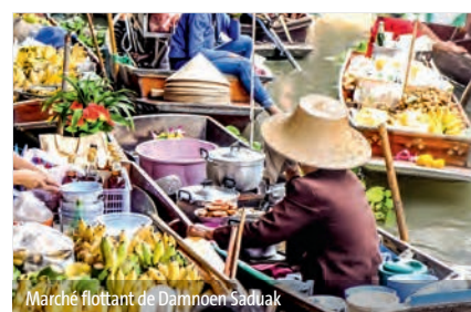
Marché flottant de Damnoen Saduak