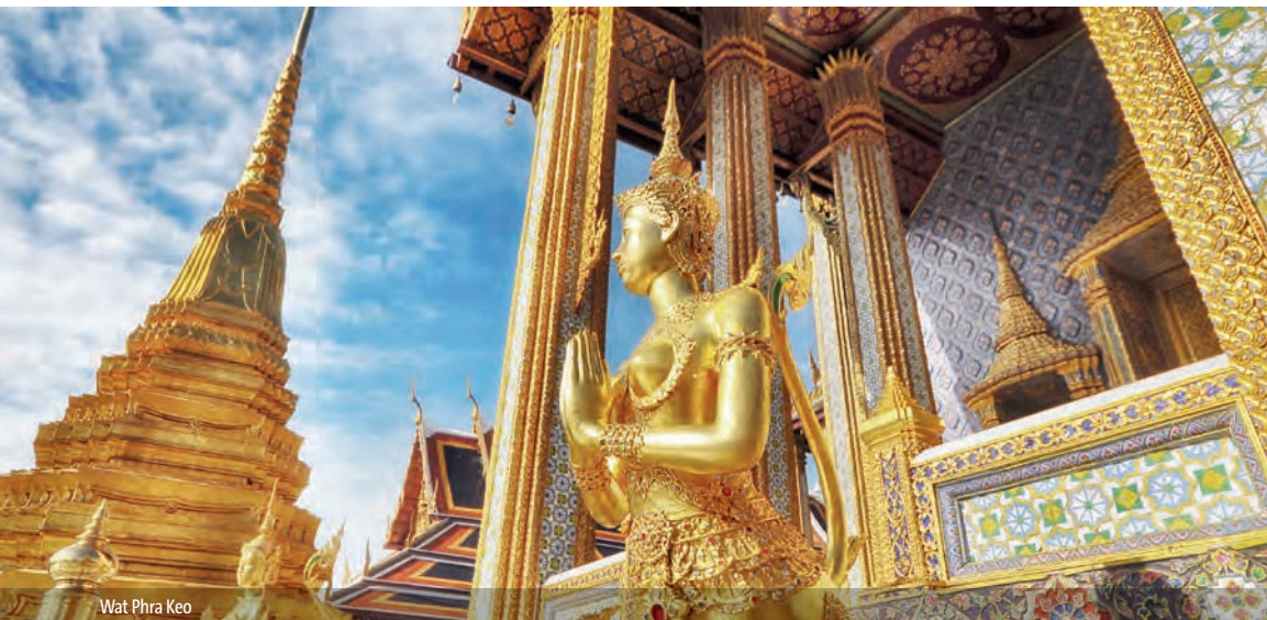
Wat Phra Keo