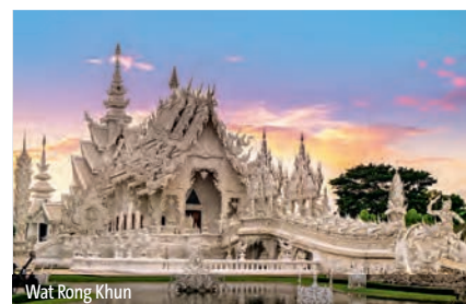
Wat Rong Khun